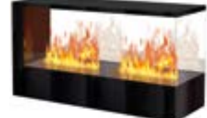
Inside-3S Slim mit 2 Brenner Medium 3D-Einbausatz B: 500 H: 680 T: 1330 mm

Inside-3S Slim mit 1 Brenner Stone-Fire Medium € 4.430,-