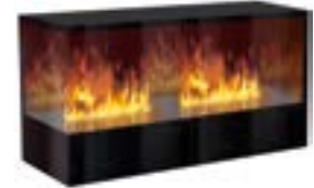
Inside-2S mit 2 Brenner Medium Links- oder Rechtsausführung 3D-Einbausatz B: 1270 H: 680 T: 450 mm

Inside-2S mit 1 Brenner Stone-Fire Medium € 4.110,-