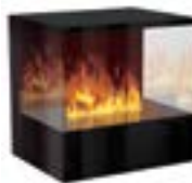
Inside-3S mit 1 Brenner Medium 3D-Einbausatz B: 680 H: 680 T: 450 mm

Inside-3S mit 2 Brenner Stone-Fire Large € 8.700,-