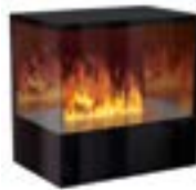
Inside-2S mit 1 Brenner Medium Links- oder Rechtsausführung 3D-Einbausatz B: 680 H: 680 T: 450 mm

Inside-2S mit 2 Brenner Stone-Fire Large € 8.160,-