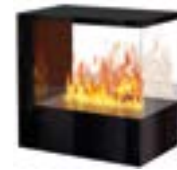
Inside-3S Slim mit 1 Brenner Medium 3D-Einbausatz B: 500 H: 680 T: 740 mm

Inside-3S Slim mit 2 Brenner Stone-Fire Large € 8.690,-