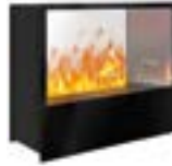
Inside-Tunnel mit 1 Brenner Medium 3D-Einbausatz B: 665 H: 603 T: 340 mm

Inside-Tunnel mit 2 Brenner Stone-Fire Large € 6.430,-