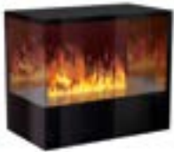
Inside-2S mit 1 Brenner Large Links- oder Rechtsausführung 3D-Einbausatz B: 870 H: 680 T: 490 mm

Inside-2S mit 1 Brenner Steel-Fire Large € 4.810,-