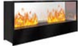
Inside-Tunnel mit 2 Brenner Medium 3D-Einbausatz B: 1255 H: 603 T: 340 mm

Inside-Tunnel mit 1 Brenner Stone-Fire Medium € 3.235,-