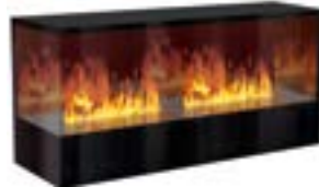
Inside-2S mit 2 Brenner Large Links- oder Rechtsausführung 3D-Einbausatz B: 1570 H: 680 T: 490 mm

Inside-2S mit 1 Brenner Stone-Fire Large € 4.950,-