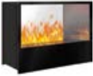
Inside-Tunnel mit 1 Brenner Large 3D-Einbausatz B: 815 H: 603 T: 415 mm

Inside-Tunnel mit 1 Brenner Steel-Fire Large € 3.765,-