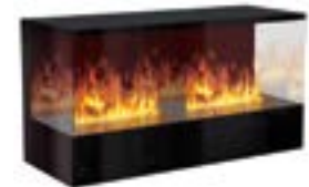
Inside-3S mit 2 Brenner Medium 3D-Einbausatz B: 1250 H: 680 T: 450 mm

Inside-3S mit 1 Brenner Stone-Fire Medium € 4.310,-