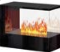
Inside-3S Slim mit 1 Brenner Large 3D-Einbausatz B: 600 H: 680 T: 880 mm

Inside-3S Slim mit 1 Brenner Steel-Fire Large € 5.095,-