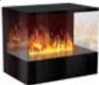
Inside-3S mit 1 Brenner Large 3D-Einbausatz B: 800 H: 680 T: 550 mm

Inside-3S mit 1 Brenner Steel-Fire Large € 5.080,-