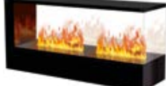
Inside-3S Slim mit 2 Brenner Large 3D-Einbausatz B: 600 H: 680 T: 1630 mm

Inside-3S Slim mit 1 Brenner Stone-Fire Large € 5.240,-