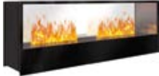
Inside-Tunnel mit 2 Brenner Large 3D-Einbausatz B: 1560 H: 603 T: 415 mm

Inside-Tunnel mit 1 Brenner Stone-Fire Large € 3.910,-